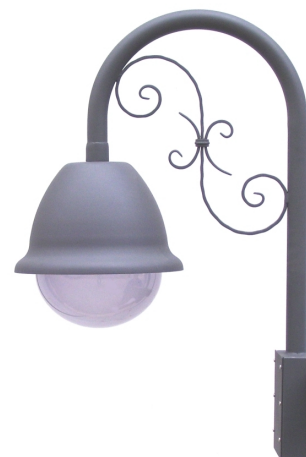
CSI250+STA250 -old style-